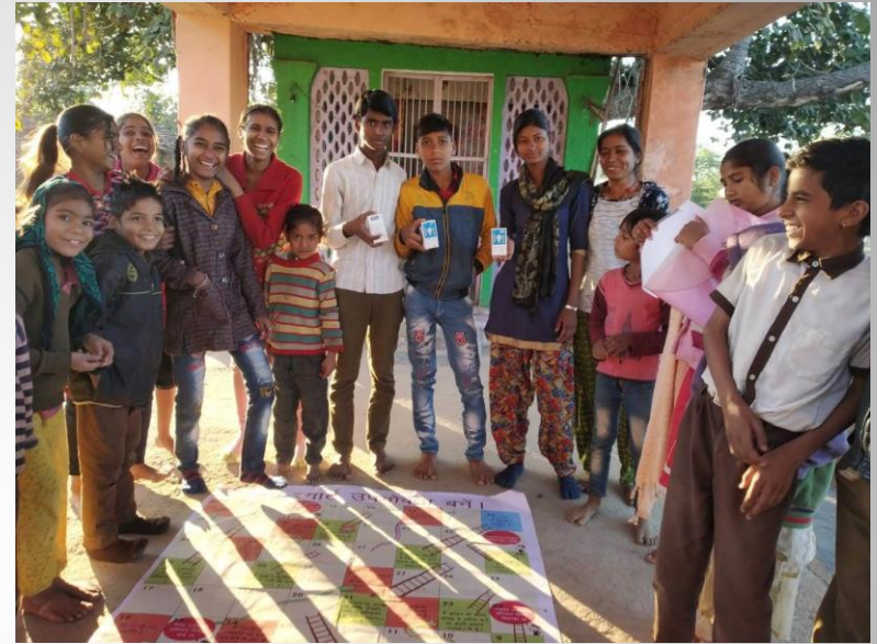
Snake & Ladder, Children Meeting & Quiz , Place – Eral, Date – 9.1.20