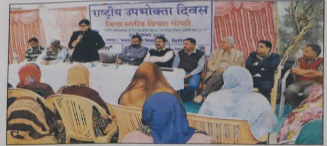
चित्तौड़गढ़। गोष्ठी को संबोधित करते जिला रसद अधिकारी।